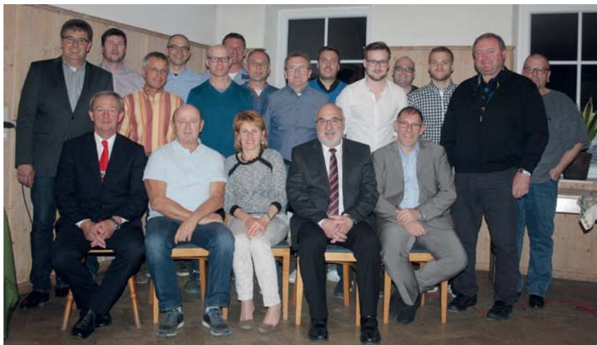
Die neu gewählte Vorstandschaft mit Bürgermeister Erwin Schneck