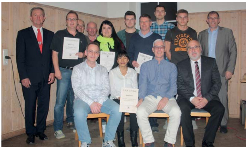
Ein Teil der geehrten Mitglieder